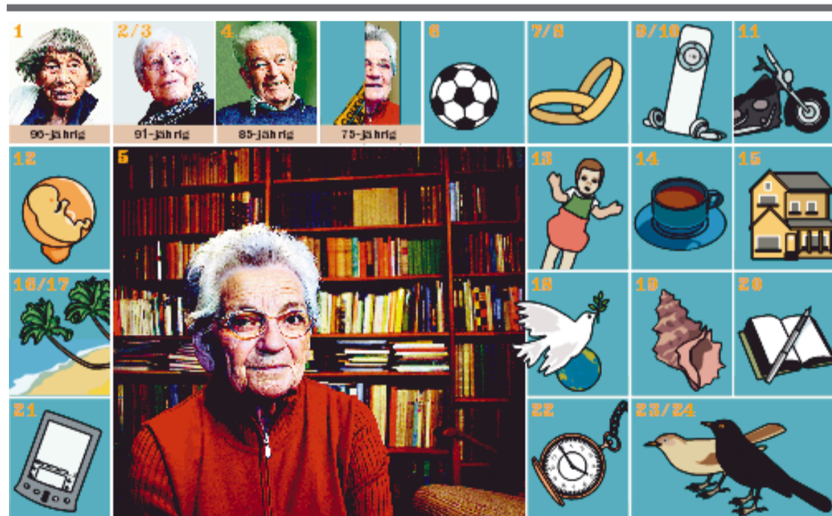
TA-GRAFIK EK, KMH

Arbeiten von Fabian Keiser im Internet: www.maelstrom.ch und www.fabiankeiser.com Weitere Informationen über den Lehrgang Animation Mentor: www.animationmentor.com